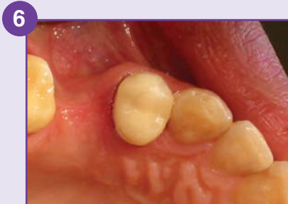
6 Scellement de la provisoire.