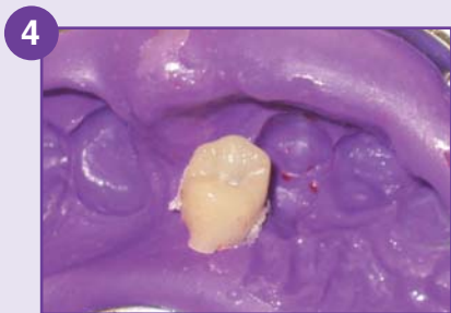
4 Après polymérisation, la couronne provisoire est dégagée.