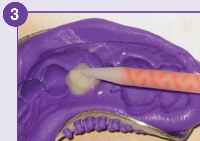
3 Provicrown est déposé directement dans l'empreinte.