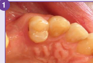
1 14 avant la préparation : Prendre l'empreinte.