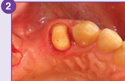
2 14 après la préparation.